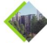
НОВОЕ ТУШИНО 01/17 КВАРТАЛ

ИП-квартал «Новое Тушино» – комфортный современный микрорайон со всей важной инфраструктурой, включающей удобный паркинг, а также медицинский центр, школу и детские сады. Расположен на новостройке неподалеку от деревни Пугачево на Северо-Западе Москвы.