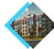
ЗАПАДНОЕ КУНЦЕВО 01/17 КВАРТАЛ

ИП-квартал «Сколковский» расположен по соседству с инновационным центром «Сколково». Здесь есть все для комфортной жизни! Огороженная территория, школа, 2 детских сада, паркинг, детские и спортивные площадки.