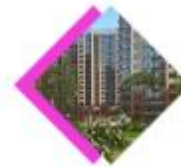
СКОЛКОВСКИЙ 01/17 КВАРТАЛ

Дом «Дыхание» – это новый премиальный жилой проект, который ФСК «Лидер» реализует в Тимирязевском районе. Дизайном всех квартир, эксплуатируемой кровли, а также входных групп занимались мастера YOO inspired by Starck. Это экологически чистая зона – совсем рядом раскинулся большой парк.